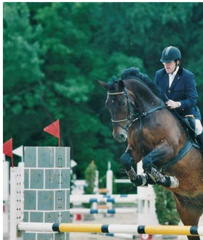
«Reiter und Pferd müssen fit sein, sonst gehts nicht.»