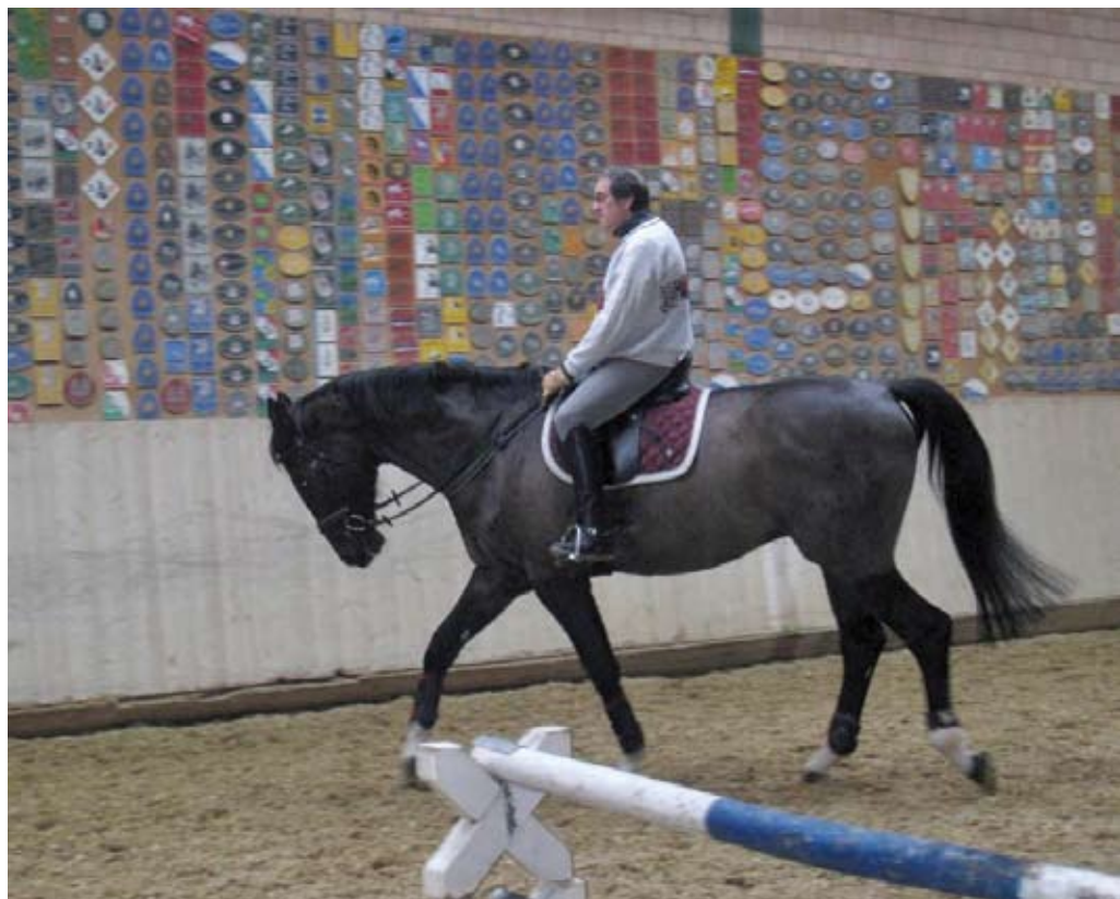
«Ein gutes Pferd braucht viel Bewegung, wie Weidegang und längere Ausritte.»

Fehler macht. Ebenso gehe ich viel mit Nico ins Gelände, wo er sich von der Arbeit erholen kann. Reiter und Pferd müssen fit sein, sonst gehts nicht. Die Schwierigkeiten im Parcours liegen bei den Distanzen und der technischen Linieneinführung.